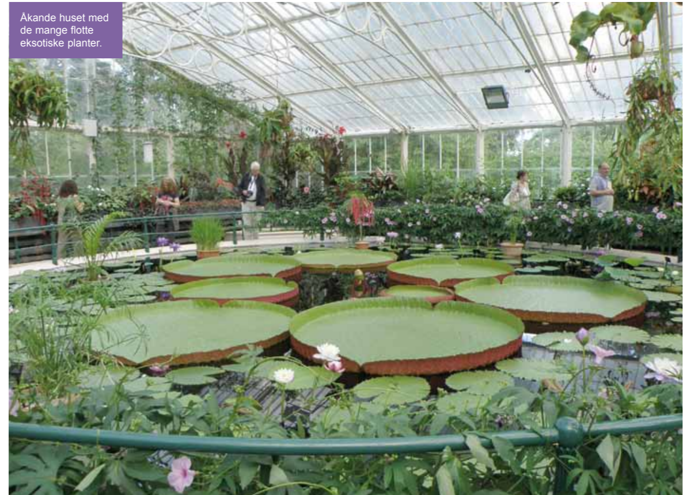
Akande huset med de mange flotte eksotiske planter.