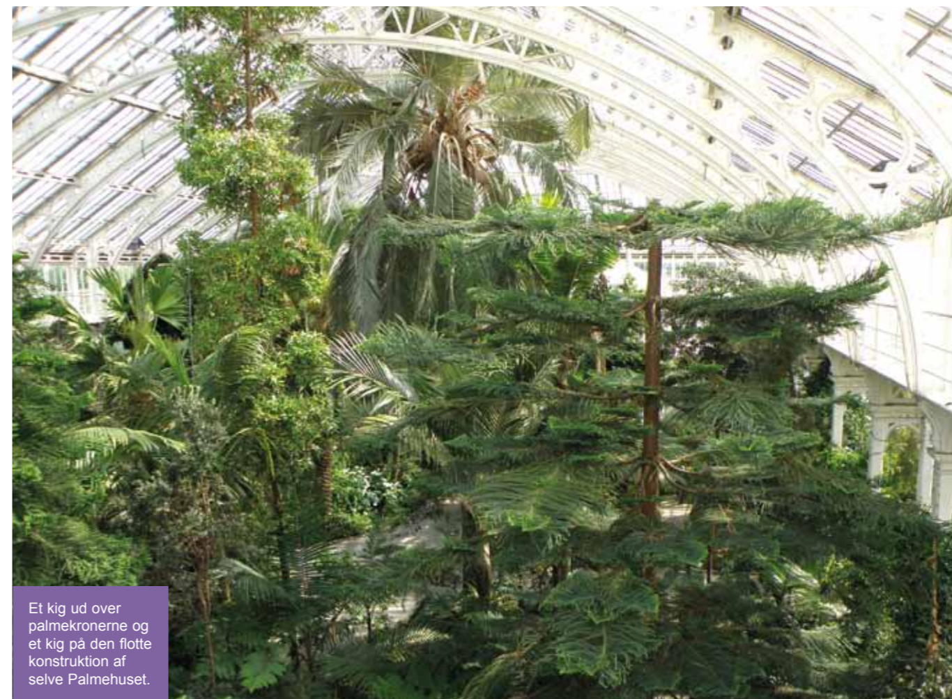
Et kig ud over palmekronerne og et kig på den flotte konstruktion af selve Palmehuset.

som lå under de fine jernriste i gulvet. En tunnel går mellem palmehuset og Victoria Gate indgangen, en stækning på 150 m, og den blev brugt til at lede røgen væk fra palmehuset, men samtidig som forsyningsvej for kullene til kedlerne. I dag bliver denne tunnel bl.a. brugt til palmehusets opsynsmands kontor, og huset opvarmes med gas i stedet for kul.