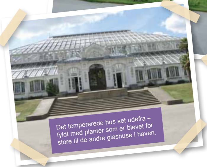
Det tempererede hus set udefra – fyldt med planter som er blevet for store til de andre glashuse i haven.