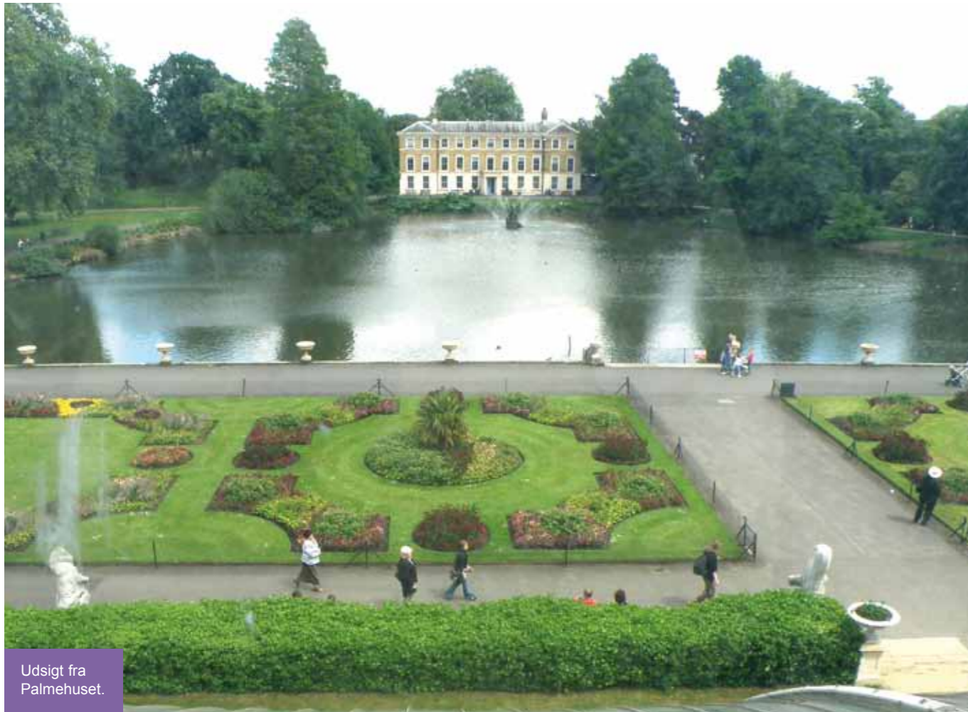
Udsigt fra Palmehuset.