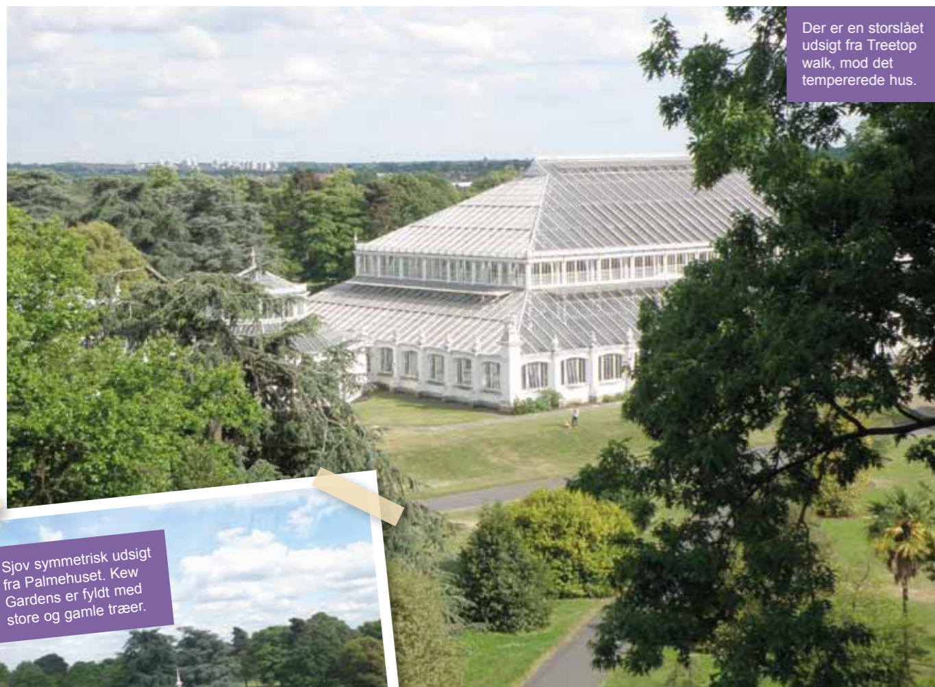
Der er en storslået udsigt fra Treetop walk, mod det tempererede hus.