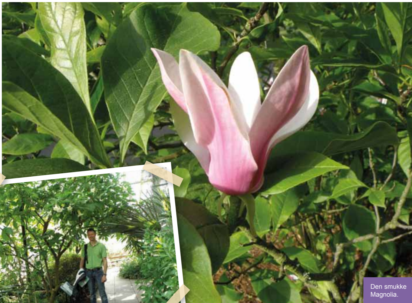
Den smukke Magnolia.