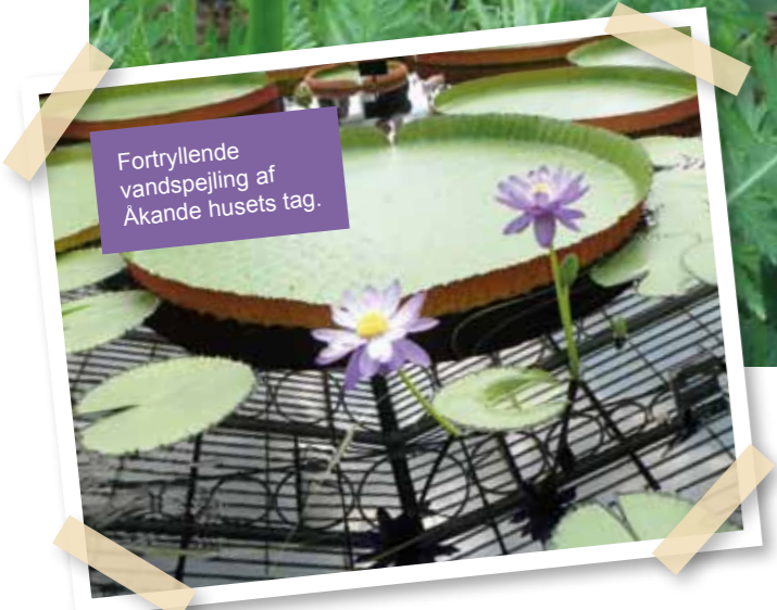
Fortryllende vandspejling af Akande husets tag.