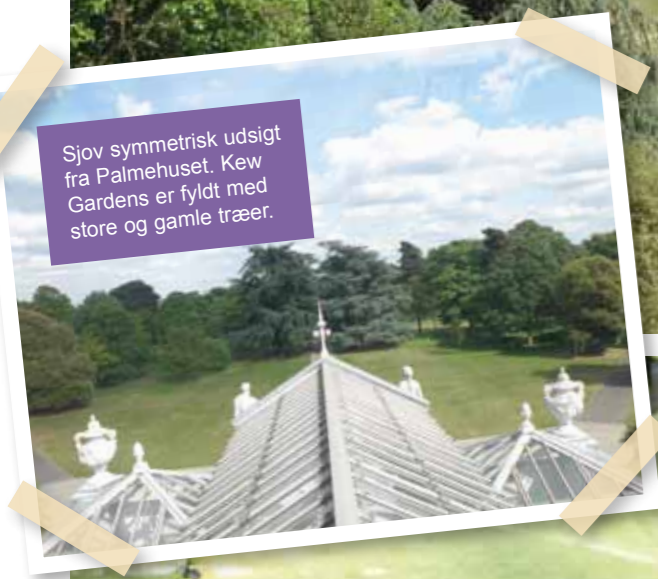
Sjov symmetrisk udsigt fra Palmehuset. Kew Gardens er fyldt med store og gamle træer.